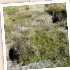
Terriers de lapin en milieu dur