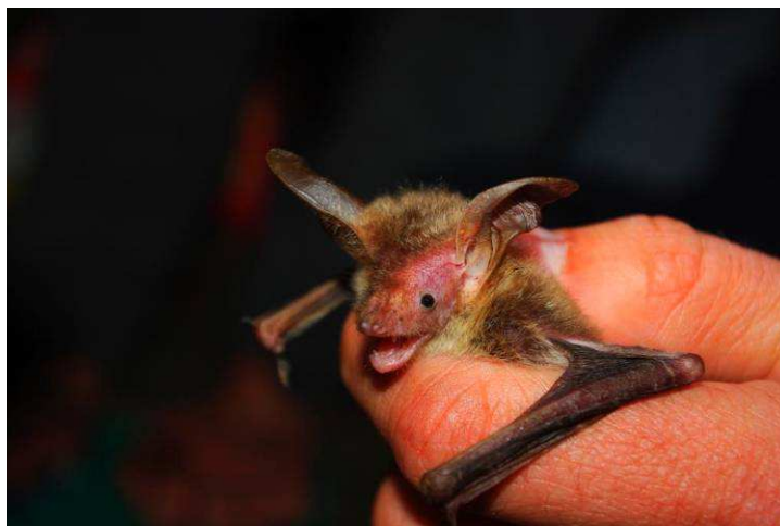
Murin de Bechstein