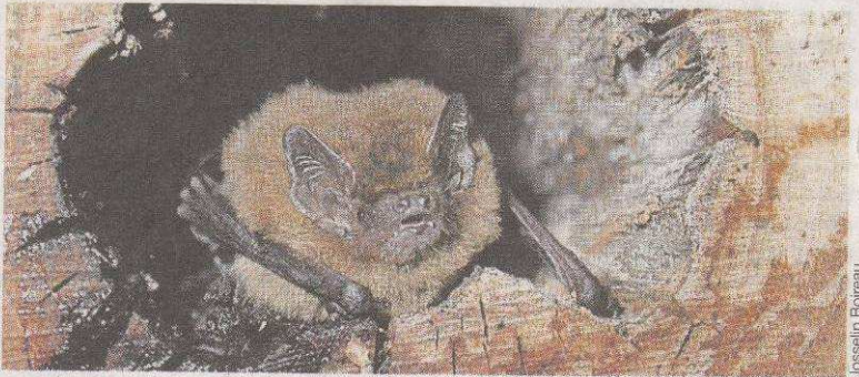
La pipistrelle commune, comme son nom l'indique, l'espèce de chauve-souris la plus répandue.

Plusieurs associations naturalistes de Loire-Atlantique organisent un week-end de « prospections chiroptères » du 18 au 20 juin.