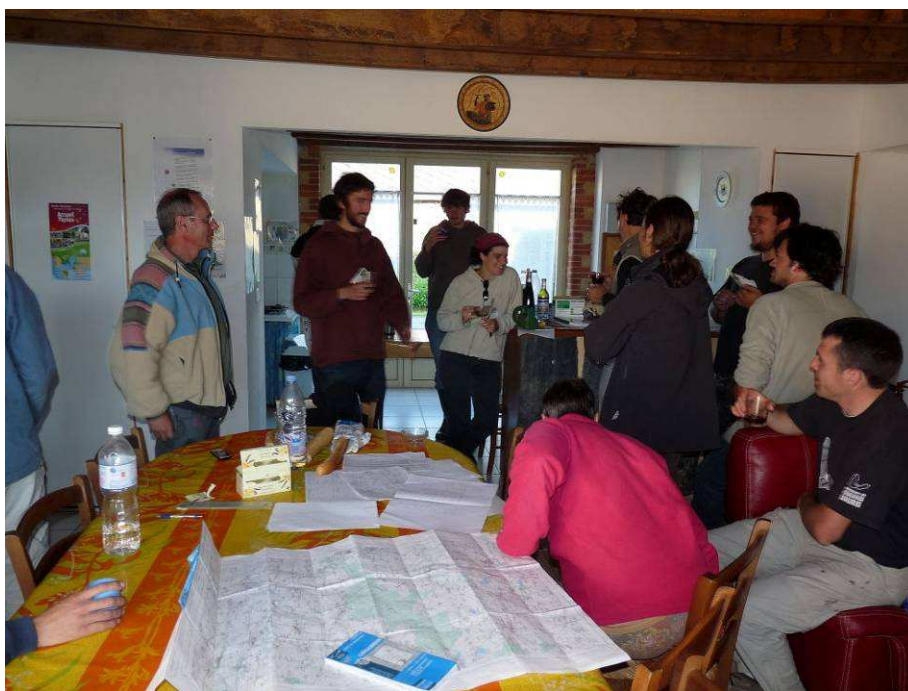
Moment convivial après les prospections de la journée