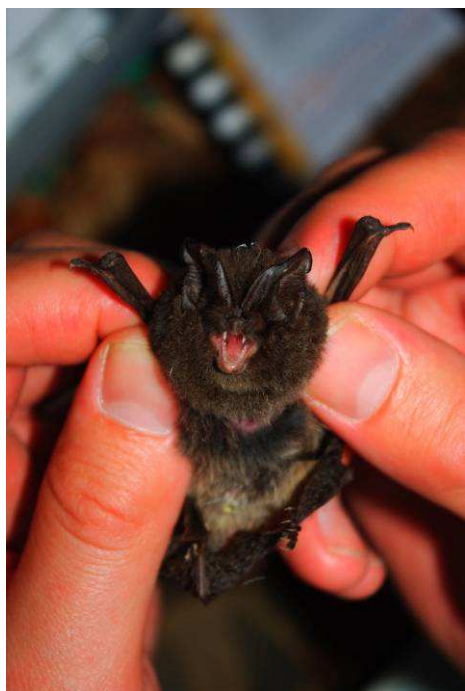
Barbastelle d'Europe