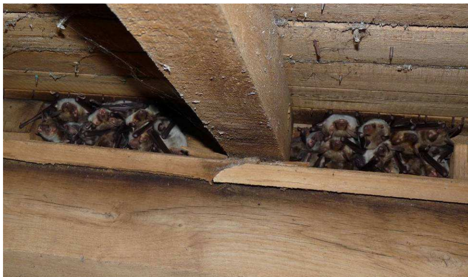
Vue d'ensemble de la colonie de Grand murin découverte