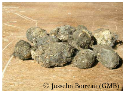
Les pelotes de réjection de la Chouette effraie contiennent de nombreux ossements de micromammifères

Le Groupe Mammalogique Breton , association d'étude et de protection des mammifères sauvages, réalise donc un inventaire et des opérations de suivi des différentes espèces de micromammifères afin de mieux connaître l'état des populations en Bretagne.