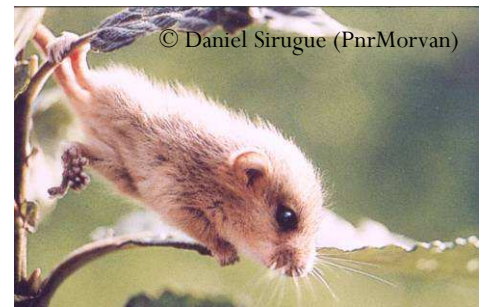
Le Campagnol amphibie, une espèce qui semble très rare aujourd'hui.