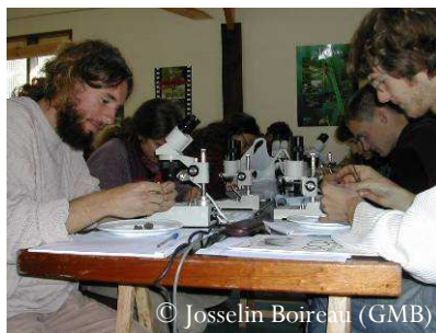
Analyse de pelotes de réjection par les bénévoles du Groupe Mammalogique Breton