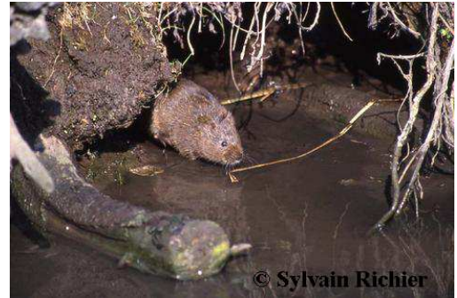
Le discret Rat d'eau fréquente les berges de certains cours d'eau.

Ce rongeur discret est le plus gros campagnol d'Europe. Il mesure 16 à 22 cm de long (dont 11 à 13 cm pour la queue) et pèse 100 à 280 g. Il habite les berges des cours d'eau lents, plans d'eau, les marais ou des tourbières. Il y creuse un terrier de quelques centimètres de diamètre ou se fabrique un nid de végétaux. Au contraire de ses concurrents introduits que sont le Ragondin et le Rat musqué, c'est une espèce autochtone qui ne fragilise pas les berges à grande échelle. Principalement végétarien (plantes aquatiques, roseau, jonc, racines, etc.) il ne dédaigne pas quelques petits animaux (insectes, porte-bois).