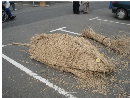
Un radeau en forme de Campagnol amphibie fabriqué par des bénévoles du GMB à l'occasion de la fête de l'Elorn le 3 mai 2008.

On ne trouve le Campagnol amphibie ( Arvicola sapidus ) qu'en France, en Espagne et au Portugal. Dans plusieurs régions françaises, des naturalistes signalent une régression de l'espèce sans qu'on puisse en mesurer réellement l'ampleur. Les causes pouvant expliquer ce déclin sont multiples. La lutte chimique par anticoagulants contre le Rat musqué et le Ragondin pourrait notamment avoir eu un effet dévastateur sur ses populations. La dégradation de son habitat, la concurrence avec le Rat musqué, le Ragondin et le Surmulot, la prédation par le Vison d'Amérique figurent également parmi les causes possibles. En Bretagne, de bonnes populations semblent encore présentes, mais il a disparu de plusieurs sites. Une vigilance sur l'état de ses populations et les causes éventuelles de régression est donc de mise.