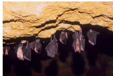
Colonie de grands rhinolophe – Laurent Arthur

Les chauves-souris sont totalement inoffensives, elles ne sucent pas le sang et elles ne s'accrochent pas dans les cheveux. En France, les 34 espèces de chauves-souris (21 en Bretagne) sont strictement insectivores. A la mauvaise saison, elles hibernent dans des grottes ou des arbres creux. Au printemps elles fréquentent en particulier les greniers d'habitations et les vieux ponts en pierre. Les femelles se rassemblent en été pour élever leurs petits. A l'heure actuelle les chiroptères sont gravement menacés par la destruction de leurs gîtes et par l'utilisation de pesticides. C'est en raison de ces sévères menaces que toutes les chauves-souris sont protégées par la loi.