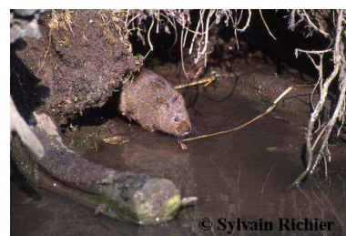
Campagnol amphibie – Sylvain Richier

Ces animaux méconnus (mulots, campagnols, musaraignes...) nécessitent toute notre attention... Certaines espèces vivant dans les champs ont vu leur nombre diminuer, conséquence directe de la modernisation agricole. La destruction du bocage, des zones humides, l'utilisation de biocides ont aussi une grande part de responsabilité dans la régression importante de certaines populations de micromammifères.