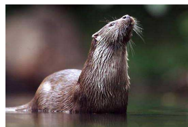
Loutre d'Europe – Erwan Balança

La Loutre d'Europe est un mammifère de grande taille (6 à 8 kg en moyenne pour 90 à 120 cm) qui fréquente les milieux aquatiques et saumâtres (rivières, étangs, littoral...). Espèce autrefois commune sur tout le territoire français, la Loutre a énormément régressé, notamment du fait du piégeage pour le commerce de sa fourrure, ce qui a justifié sa protection en 1981. Disparue de la plus grande partie de son aire de répartition originelle, la Loutre est demeurée présente en Bretagne, même lorsque les effectifs étaient au plus bas. En cela, notre région est demeurée un bastion pour cette espèce. Aujourd'hui la Loutre est en expansion mais les populations restent fragiles et menacées par les collisions routières et la destruction de ses habitats.