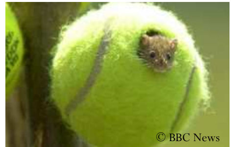
Le Rat des moissons, une espèce discrète dont l'étude est facilitée par la pose de nichoirs.

Le Rat des moissons Micromys minutus est le plus petit rongeur d'Europe. Il ne pèse que six grammes ! Ce micromammifère possède une longue queue préhensile qui lui permet de circuler dans les grandes herbes, les haies ou les roselières, mais aussi les champs de céréales qui lui servent d'habitat. Ce grand consommateur de végétaux, de graines, de baies mais aussi d'insectes, construit un nid en boule d'environ 8 cm de diamètre en entrelaçant des feuilles et des tiges à environ 1 m au dessus du sol. C'est dans ce nid que les femelles mettront bas jusqu'à 6 portées par an de 4 à 7 petits. Si cette espèce n'est pas considérée comme une espèce en danger, dans certaines régions, comme la Grande-Bretagne, le Rat des moissons semble se raréfier dans les zones d'agriculture intensive.