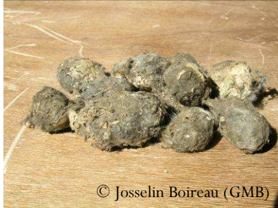
Les pelotes de réjection de la Chouette effraie contiennent de nombreux ossements de micromammifères

Le Groupe Mammalogique Breton , association d'étude et de protection des mammifères sauvages, réalise donc un inventaire et des opérations de suivi des différentes espèces de micromammifères afin de mieux connaître l'état des populations en Bretagne.