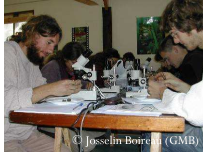
Analyse de pelotes de réjection par les bénévoles du Groupe Mammalogique Breton