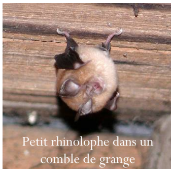
Petit rhinolophe dans un comble de grange

Les chauves-souris sont dépourvues de tout comportement constructeur et ne détériorent pas les constructions. C'est donc d'abord pour expliquer que la cohabitation avec ces animaux menacés n'est qu'à de rares exceptions près une source de désagrément pour nous, que l'association propose cet engagement aux propriétaires.