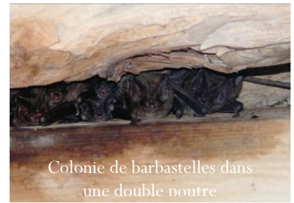
Colonie de barbastelles dans une double noure

La Bretagne accueille une diversité insoupçonnée de chiroptères (nom scientifique qui signifie "main ailées") puisque avec 21 espèces identifiées, ces demoiselles nocturnes représentent plus du quart des espèces de mammifères sauvages de la région.