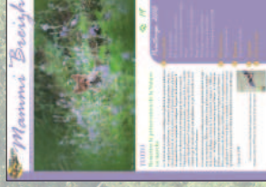
Mammifères Breizh, bulletin de liaison du GMB (2 numéros par an)