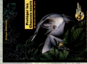
Protéger les chauves-souris en milieu naturel ou bâti