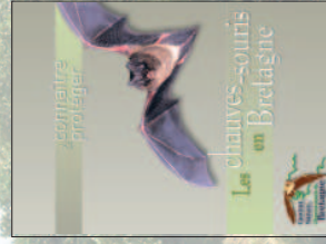
Plaquette "Les chauves-souris en Bretagne"