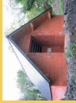
Deux aménagements réalisés grâce au Fonds : un bâtiment pour les mammifères sauvages et un chalet sous combles pour une colonie de Petits rhinolophes