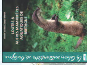
Loutre et autres mammifères aquatiques de Bretagne