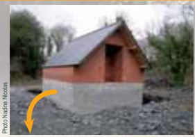
Vue de l'étage «hivernage» avant remblaiement.

Sous-sol obscur semi-enterré pour des conditions fraîches et stables en hiver (unique accès par une trémie dans la dalle de béton du niveau supérieur). Murs en parpaings recouverts de remblais.