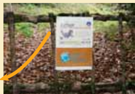
Barrière construite par les bénévoles