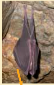
Grand rhinolophe en hivernage dans une ardoisière du Canal de Nantes à Brest

35 gîtes découverts par le GMB dans les galeries d'ardoisières à l'abandon regroupent en hiver 2000 Grands rhinolophes Rhinolophus ferrumequinum , soit environ la moitié des hivernants de Bretagne . Ce réseau se prolonge à l'Ouest par celui des blockhaus de la Presqu'île de Crozon.