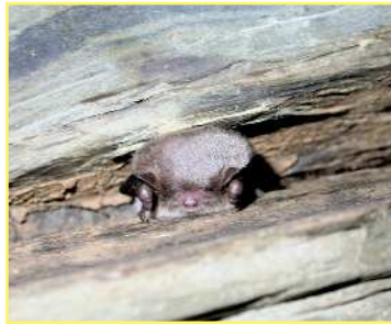
Murin de Daubenton sous un pont

Espèces protégées , ces fragiles petits mammifères sont pourtant rarement pris en compte lors des travaux d'entretien ou de rénovation du bâti. La présence de ces animaux très discrets étant souvent ignorée, leurs gîtes peuvent être involontairement détruits.