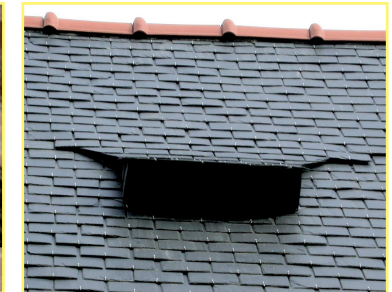
Nichoirs artificiels et ouverture pour les chauves-souris dans une toiture

La charte est un document de 19 pages organisé en 4 feuillets :